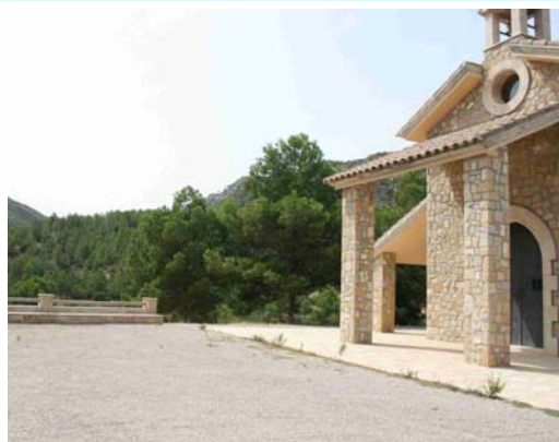
Foto. Ermita de Sta Paulina i entorn forestal immediat

La finca de l'Ermita de Santa Paulina constitueix una superfície relativament gran de tipus forestal (de propietat municipal) amb un potencial i necessitats evidents en relació a la gestió. Cal tenir en compte que aquesta finca es troba inclosa a la peça de territori d'Ascó inclosa dins de l'espai del Pas de l'Ase i per tant té una importància clau en la regulació dels seus usos antròpics i la seva implicació amb la prevenció i possibles intervencions d'extinció, en cas de produir-se un incendi forestal. La finca està gestionada íntegrament per l'Ajuntament d'Ascó (el manteniment el realitza la brigada municipal).