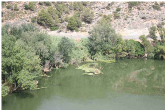
Foto. Un dels possibles trams del bosc de ribera a restaurar

restaurar les comunitats existents del bosc de ribera, a l'entorn dels àmbits que es considerin com a prioritaris, definits prèviament pels autors del document tècnic i seguint les preferències i prioritats que indiqui el mateix consistori d'Ascó.