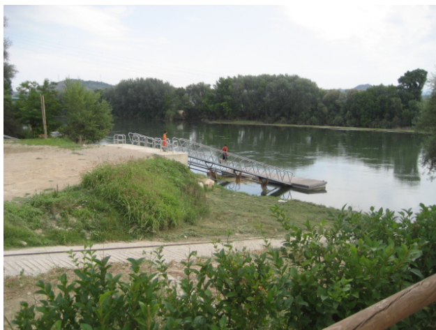
Foto. Situació actual de la plaça de l'embarcador

El Pla Territorial Parcial de les Terres de l'Ebre (PTPTTEE) preveu la creació d'un port esportiu a l'àmbit de l'actual embarcador d'Ascó. Atès que l'embarcador (aigües amunt fins el pont de la C-12 i aigües avall fins al meandre de davant l'Illa, al costat dret del riu) es troba en un tram molt antropitzat (presència d'escullera i enjardinaments propers) caldria poder integrar el projecte del port esportiu dins d'una proposta de definició de parc fluvial que faci compatible la construcció i gestió de les activitats nàutiques amb la protecció, millora i gestió de la biodiversitat existent en aquest tram del riu Ebre, al seu pas per Ascó.