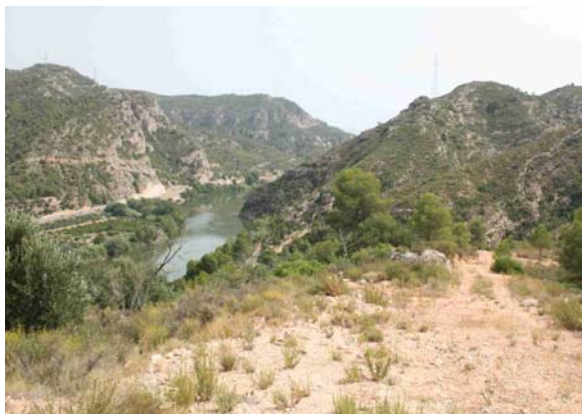
Foto. Imatge del Pas de l'Ase en el context de zones de protecció especial

L'espai natural del Pas de l'Ase constitueix un dels elements més significatius de riquesa de biodiversitat en el context del terme municipal. Arran del grau de protecció existent actualment a l'espai -en forma de Xarxa Natura 2000- caldrà que per llei es desplegui un pla de gestió de l'espai que haurà de ser impulsat, redactat i liderat per un ens de rang superior al consistori municipal (en aquest cas, el Departament de Medi Ambient i Habitatge de la Generalitat de Catalunya).