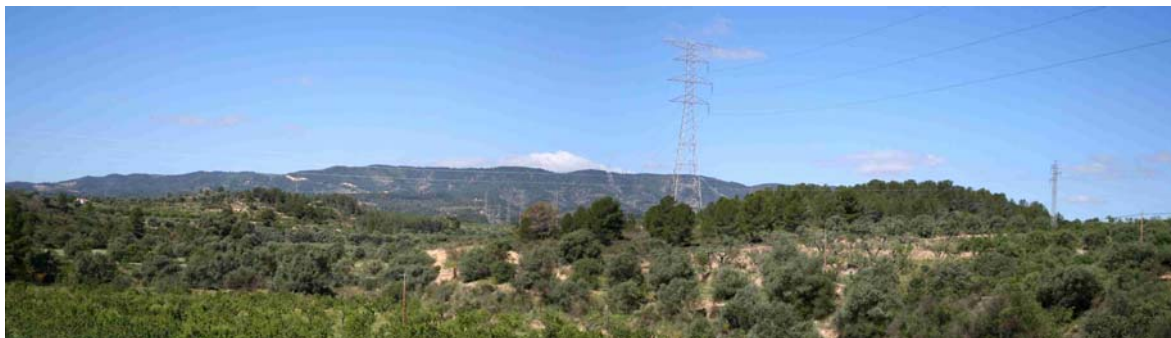
Foto. Traçat de les línies elèctriques que connecten amb la central nuclear

Com en la majoria de nuclis urbans rurals el Ascó presenta traçat elèctric de línies aeri en bona part dels carrers del casc urbà de la població. Aquest fet, suposa un deteriorament paisatgístic i d'estètica visual dels carrers de la zona antiga. Per tal de poder solucionar aquesta qüestió, l'acció proposa que es tingui en compte el finançament parcial i/o total del soterrament de les línies al casc urbà, ja sigui a través d'una línia directa derivada del pressupost municipal o via les línies de subvencions facilitades per l'ajuntament en relació a la realització d'obres, rehabilitacions, etc. del casc urbà. La idea és que caldria buscar vies de finançament indirectes que no repercutissin en cap moment sobre els veïns del casc urbà. Per altra banda, caldria incorporar en la normativa del nou POUM la condició d'obligarietat de soterrar qualsevol línia en el planejament associat a la trama urbana.