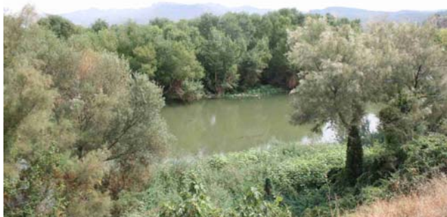
Foto. Vista de la vegetació de l'Illa

Com en bona part dels àmbits rurals dels municipis per on discorre el riu Ebre, a Ascó existeix un número relativament important de parcel·les agrícoles abandonades a tocar de la llera del riu que podrien funcionar com a zona de transició de vegetació de ribera i zones de cultiu.