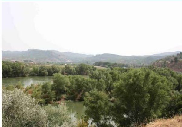
Foto. Vista de la vegetació de l'Illa

L'espai natural de l'Illa d'Ascó constitueix un dels elements més significatius de riquesa de biodiversitat en el context de l'ambient de ribera lligat al riu Ebre. Arran del grau de protecció existent actualment a l'espai -en forma de Xarxa Natura 2000- caldrà que per llei es desplegui un pla de gestió de l'espai que haurà de ser impulsat, redactat i liderat per un ens de rang superior al consistori municipal (en aquest cas, el Departament de Medi Ambient i Habitatge de la Generalitat de Catalunya).