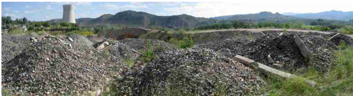
Foto. Un descampat amb runes entre la zona d'afectació de la central i la delimitació del polígon industrial

Actualment, als terrenys que es troben a tocar del nord del polígon industrial i a la zona de transició que hi ha entre la superfície del polígon i el perímetre de l'àrea d'influència de la central nuclear s'hi troba una gran extensió d'acopis de residus de runa de la construcció. Òbviament, la presència d'aquests residus implica un agreujant del paisatge i denota una imatge negativa en vers la visual que es té de les instal·lacions de la Central Nuclear, des del polígon industrial d'Ascó.