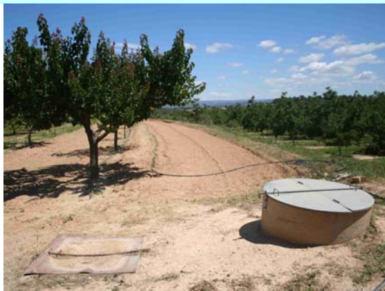
Foto. Detall d'uns dels pous de la zona de reg propera al riu

Des del Departament d'Interior de la Generalitat i a través de la gestió de sistemes de tractament d'emergències, s'està en fase d'iniciar durant el 2009 els treballs de descontaminació del Pantà de Flix. Aquest procés porta associat un pla d'emergències específic que lògicament (per proximitat al terme d'Ascó) afecta d'una manera directa al context territorial del municipi.