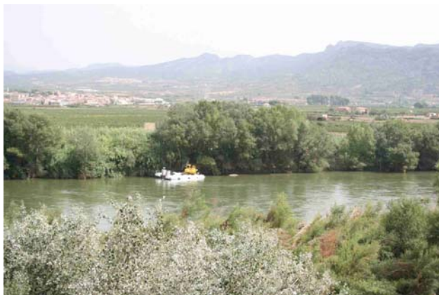
Foto. Vista de la vegetació de l'Illa

Una de les sortides per la diversificació turística que presenta el municipi és potenciar les activitats nàutiques a l'entorn del riu. De fet, el Pla Territorial de les Terres de l'Ebre preveu la creació d'un port en l'actual zona de l'embarcadero. No obstant, existeixen diferents handicaps o condicionants que dificulten aquesta pràctica, sobretot els que depenen de la presència d'algues i plagues de diferents procedències (musclo zebra, cloïssa asiàtica i mosca negra) i sobretot del control del règim hídic del riu; regulat, bàsicament per la Confederación Hidrogràfica del Ebro (CHE). En aquest sentit l'acció planteja que des del consistori d'Ascó es