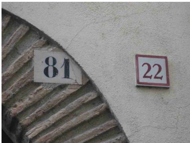
Foto. Detall de la doble senyalització en una de les cases del casc antic

En moltes de les cases del casc urbà i dels carrers existents a la part més vella del poble existeix una paradoxa relacionada amb la senyalització ambigua que hi ha en molts casos.