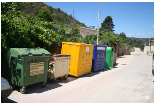
Foto. Bateria completa de contenidors en superfície a Ascó

A Ascó no es compta amb cap ordenança que reguli com s'han de gestionar els residus municipals. Des de 2006 la recollida selectiva dels residus urbans ha disminuït pel que fa a les dades de recollida. La implantació de la recollida de matèria orgànica al municipi va suposar un augment de les deixalles separades selectivament, a mitjans de 2008 aquesta tendència es va torçar i es va deixar de recollir selectivament la fracció orgànica. Aquesta fracció comptava amb un alt percentatge d'impropis.