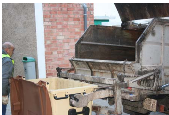
Foto. Buidatge de contenidors de matèria orgànica

L'ordenança és una de les eines més adequades i necessàries per regular aspectes de gestió del medi ambient en l'àmbit municipal. Permet regular el sistema de recollida, produeix efectes jurídics de cara a tercers i dota l'ens local de capacitat jurídica i sancionadora. S'ha d'entendre que la recollida selectiva és tant un deure com un dret cívic i que per avançar cap a una gestió sostenible dels residus cal una separació en origen. En una ordenança s'han de marcar els drets i deures respecte la recollida selectiva que es poden articular de la següent manera: principis bàsics, objecte i àmbit, definicions, drets i deures, infraccions, control de l'activitat i sancions.