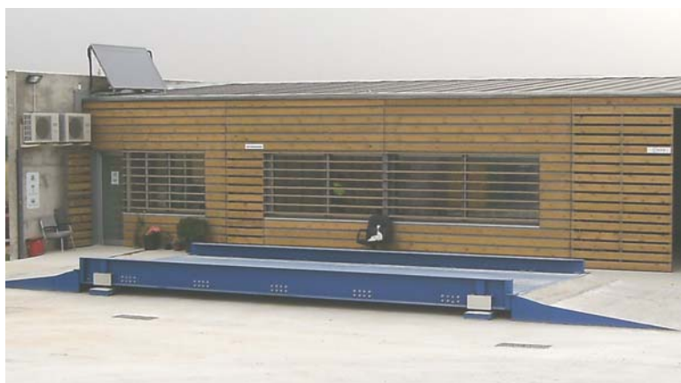
Foto. Sistema de pesatge de la deixalleria del Morell

En aquesta acció es proposa iniciar converses amb el Consorci per a la gestió dels residus municipals de les comarques de la Ribera d'Ebre, el Priorat i la Terra Alta per buscar alternatives per portar a terme un pesatge dels residus recollits. És important poder comptar amb dades reals ja que són les que evidencien si la separació dels residus és correcta i si les dades de recollida s'ajusten al que marca la recollida. Es poden considerar diverses opcions com per exemple ubicar una bàscula a la deixalleria d'Ascó, equipar els camions amb sistema de pesatge, entre d'altres opcions.