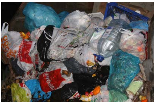
Foto. Residus recollits selectivament a Ascó del contenidor de matèria orgànica

El Programa de Gestió de Residus de Catalunya pel període 2007-2012 (PROGEMIC) defineix la prevenció com el conjunt de mesures preses abans que una substància, material o producte esdevinguin residus i que redueixi: