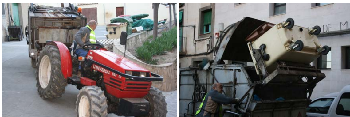
Fotos. Mitjans mecànics de recollida de la matèria orgànica i la resta

En aquesta acció es proposa que des de l'Ajuntament i per mitjà del servei d'inspecció es realitzin inspeccions periòdiques del funcionament de la contracta, ja que algunes de les obligacions del plec de prescripcions tècniques no s'estan complint.