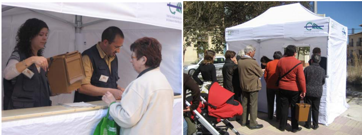
Foto. Punt d'informació a la plaça de l'Ajuntament d'Arnes i a la plaça de Catalunya d'Horta de Sant Joan

Foto. Material distribuït en la campanya d'implantació de recollida de matèria orgànica a la Terra Alta