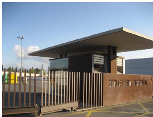
Foto. A l'esquerra, tanca de formigó de la deixalleria del Morell; a la dreta, entrada de la deixalleria de Salou.