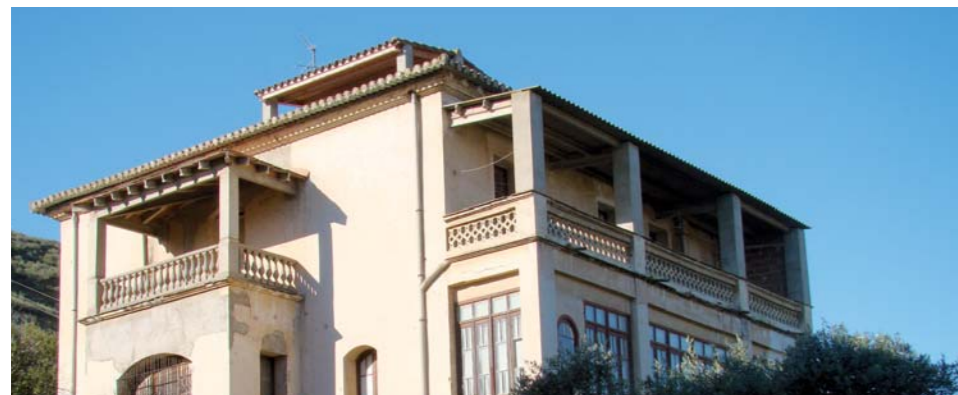
Els tràmits per rehabilitar Ca don Àngel començaran enguany

L'Ajuntament d'Ascó ha adquirit Ca don Àngel amb la intenció de situar-hi un centre d'estudis vinculat al Consorci Memorial de la Batalla de l'Ebre (COMEBE). El projecte contempla la rehabilitació del vell edifici, d'uns 600 metres quadrats, i també dels aproximadament 2.000 metres quadrats del solar adjacent per tal d'adequar-lo a una iniciativa singular dins dels municipis que acolliran centres relacionats amb els espais de la Batalla de l'Ebre.