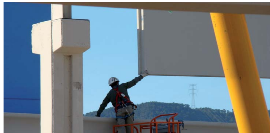
Les obres de la segona nau industrial acabaran a finals del mes de gener

Diversificar l'economia local. Aquesta és la premissa principal que regeix la política econòmica de l'Ajuntament, que després de culminar una primera nau industrial de 2.000 metres quadrats n'ha començat una de nova, de les mateixes dimensions. De moment, la primera nau està totalment compromesa i pròximament s'hi instal·laran empreses de manteniment industrial, de manufactures d'alumini i de manteniment elèctric, entre d'altres. El consistori pretén aprofitar l'efecte iman del complex nuclear per tal d'atraure empreses que tant poden estar vinculades a aquesta indústria com a d'altres, de manera que es vagi configurant al municipi un teixit industrial més