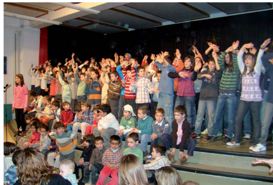
Alumnes del CEIP Sant Miquel, durant el darrer festival escolar

El ple municipal de desembre va aprovar amb la unanimitat de tots els grups polítics un increment substancial de les subvencions municipals per als estudiants, que especialment afecten els universitaris. L'Ajuntament i l'Associació Nuclear Ascó Vandellòs (ANAV) signaran properament un acord que permetrà que els estudiants universitaris que triïn unes titulacions concretes que seran afins a les feines de la central nuclear però que encarrerar estan per determinar rebin una