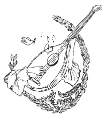
Escola de música