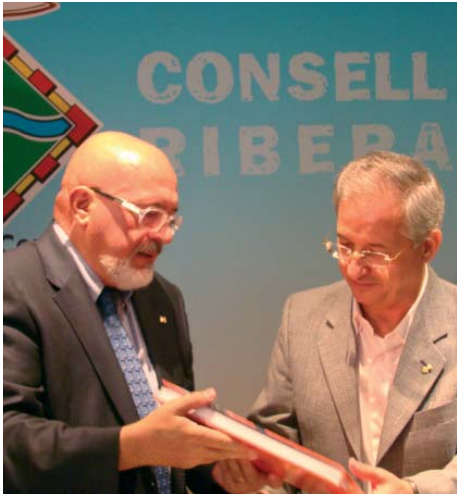
El conseller de la Generalitat, Josep Huguet i l'Alcalde, Rafael Vidal

✺✺✺ L'Ajuntament i el departament d'Innovació, Universitats i Empresa de la Generalitat van signar un protocol de col·laboració al setembre en el qual el consistori s'adheria a la proposta del departament sobre Pla Estratègic de Turisme a Catalunya 2005-2010 amb l'objectiu d'augmentar la qualitat i diversitat de l'oferta turística del municipi. Amb aquest nou pas, l'Ajuntament d'Ascó pretén assolir la sostenibilitat econòmica, social i cultural al municipi. D'acord amb aquest Pla Estratègic, la